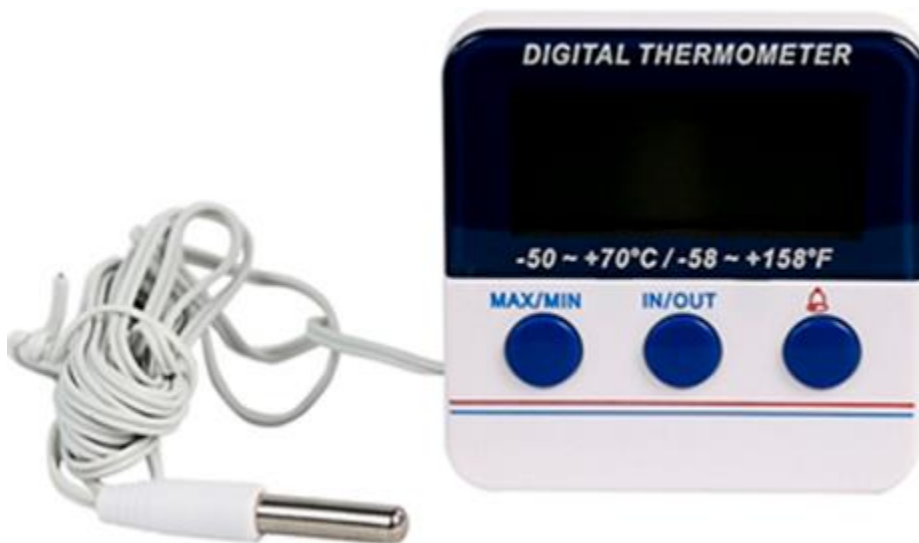
Imagem 6: Ilustração do termômetro para caixa térmica