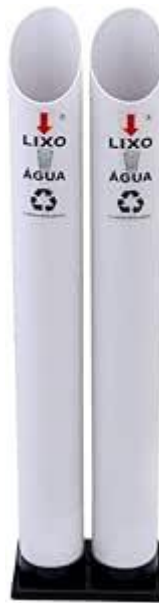
Imagem 2: Ilustração do dispensador para copos (descarte)