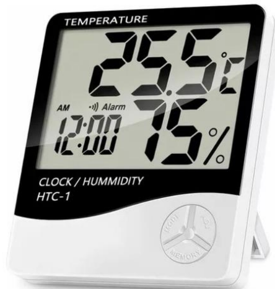
Imagem 7: Ilustração do termo-higrômetro, tipo digital