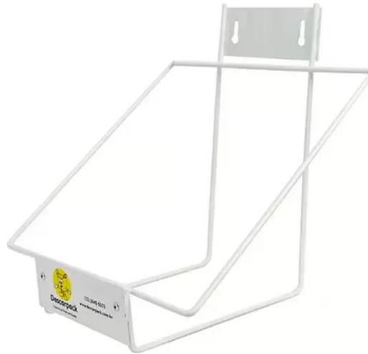
Imagem 5: Ilustração do suporte para descarpck