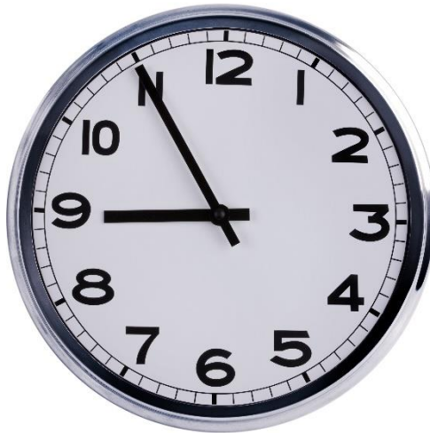
Imagem 1: Ilustração do relógio de parede